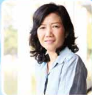
แพทย์หญิงพรณพิมล วิปุลากร รองปลัดกระทรวงสาธารณสุข