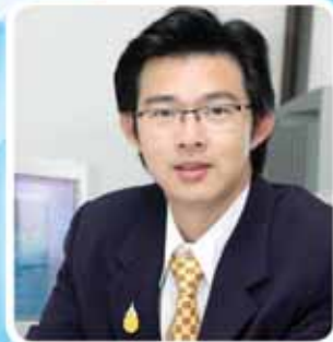
นายแพทย์ทวีศิลป์ วิชญโยธิน รักษาการในตำแหน่งสาธารณสุขนิเทศก์