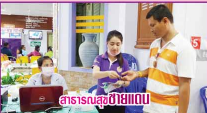
สาธารณสุขชายแดน