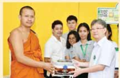
การสนับสนุนชุดความรู้เรื่องสุขภาพพระสงฆ์ เช่น การออกกำลังกายที่เหมาะสมสำหรับพระสงฆ์, ชุดความรู้สำหรับพระสงฆ์ใช้ในการเทศนาแสดงธรรมและนำประชาชน