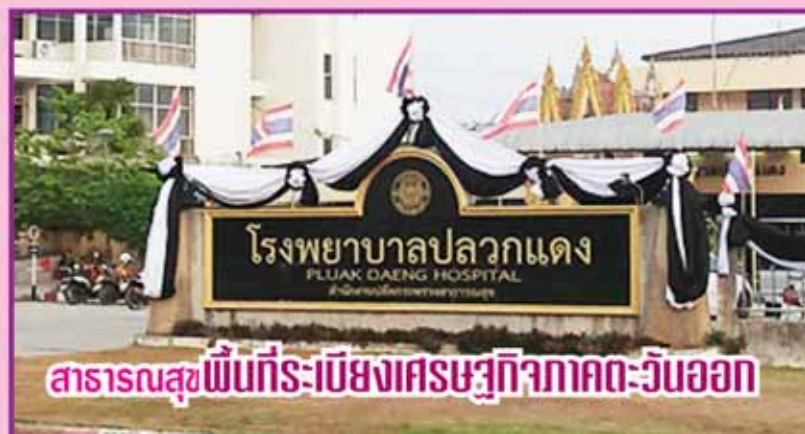
สาธารณสุขพื้นที่ระบียงเศรษฐกิจภาคตะวันออก