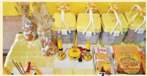
การถวายอุป - เทียนโร้ควัน

วันวิสาขบูชา มอบหมายให้โรงพยาบาลในสังกัด ทั้งโรงพยาบาลศูนย์ โรงพยาบาลทั่วไป โรงพยาบาลชุมชน ให้การอุปถัมภ์ดูแล วัดในพื้นที่อย่างน้อยโรงพยาบาลละ 1 วัด โดยมีการจัดกิจกรรมเพื่อการสร้างเสริมสุขภาพพระสงฆ์ อาทิ