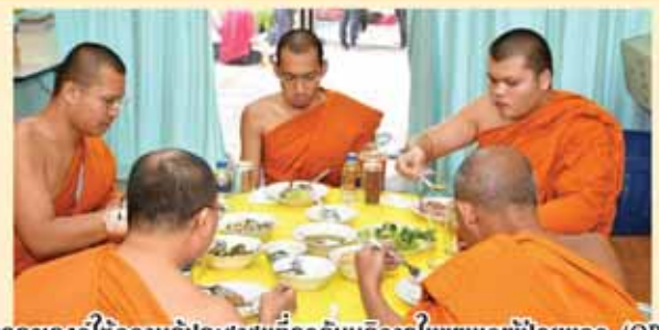
การตรวจเช็คความรู้ประชาชนที่มารับบริการในแผนกผู้ป่วยนอก (OPD) ในการถวายอาหารลดหวาน มัน เค็ม แก่พระสงฆ์