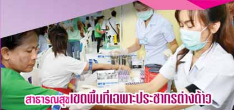
สาธารณสุขเขตพื้นที่เฉพาะ-ประชากรต่างด้าว