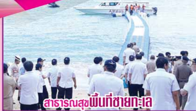
สาธารณสุขพื้นที่ชายทะเล